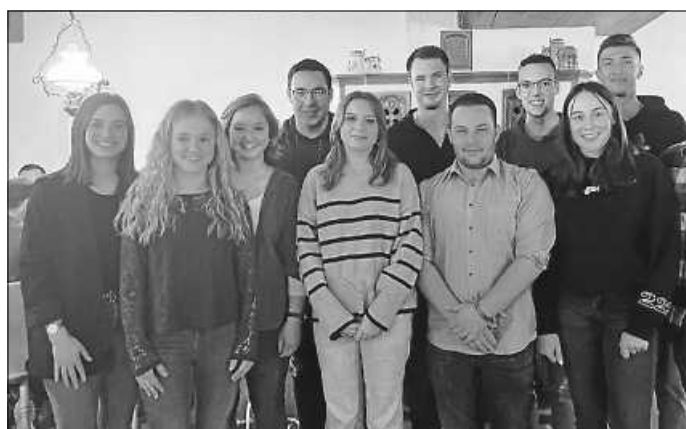
Die neue Vorstandschaft