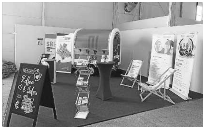
Messestand der Wirtschaftsförderung und des Welcome Centers Schwarzwald-Baar-Heuberg