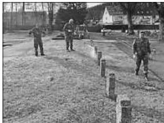
Die Grabsteine werden gereinigt