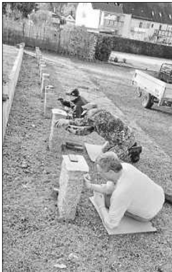
Die Grabsteine werden neu beschriftet

Am vergangenen Wochenende war es dann so weit und man konnte zur Tat schreiten. Mit sieben Mitgliedern der RK Immendingen unter ihrem Vorsitzenden Oberstabsgefreiter Matthias Scholz konnte bei bestem Wetter mit den Restaurierungsarbeiten begonnen werden. Unterstützung in Form von Geräten kam dabei vom Bauhof der Ge-