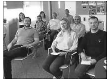
Fit fürs Vorstellungsgespräch: Das Welcome Center lädt zum informativen Seminar ein.

Das Welcome Center ist eine Einrichtung der Wirtschaftsförderung Schwarzwald-Baar-Heuberg und der IHK Schwarzwald-Baar-Heuberg sowie des Ministeriums für Wirtschaft, Arbeit und Tourismus Baden-Württemberg sowie die Förderer des Welcome Centers unterstützen das Center.