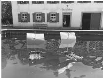
Flöße bauen: Jeanine Rötzer