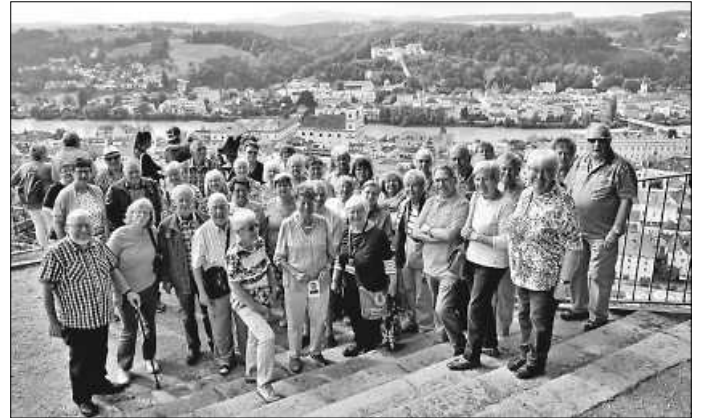
Die SWV-Reisegruppe auf der „Veste Oberhaus“ über Passau.

Nachmittags führte die kurzweilige Fahrt mit Walter an München vorbei nach Hause an die junge Donau, wobei erste Überlegungen zum Ziel der kommenden Auslandsfahrt 2020 angestellt wurden.